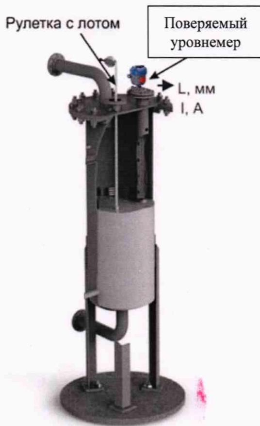
Рисунок 3 - Проверка уровнемера без демонтажа по месту эксплуатации