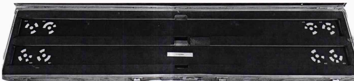
Рисунок А.3 - Общий вид специальной измерительной меры