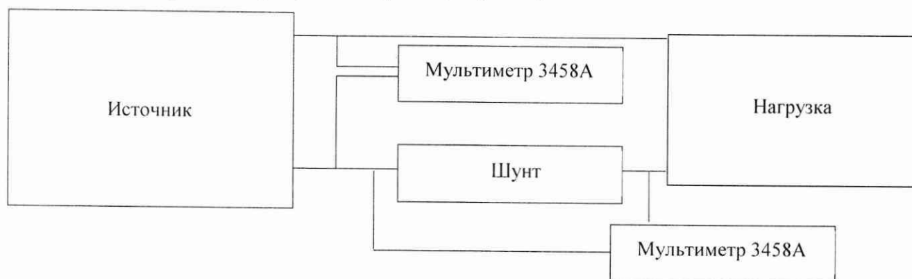
Рисунок 3 - Структурная схема определения абсолютной погрешности измерений/установки электрической мощности постоянного тока

1) собрать схему, приведенную на рисунке 3;