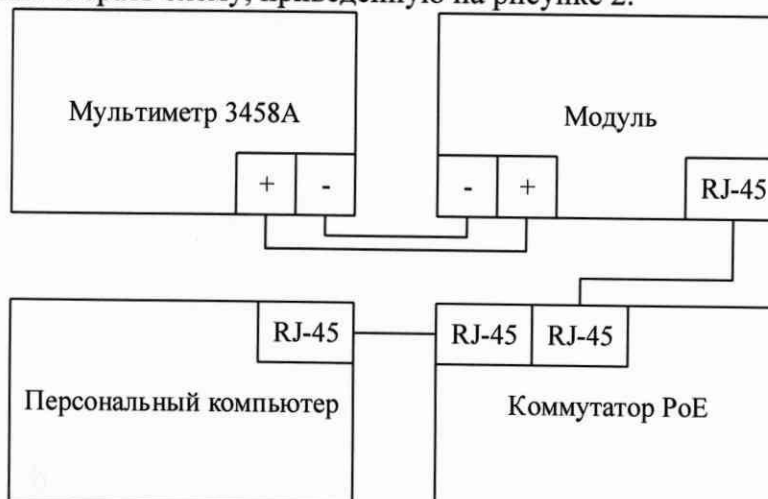
Рисунок 2 – схема определения приведенной (к верхнему пределу воспроизведений) погрешности воспроизведений силы постоянного тока

10.2.2 Необходимо собрать схему, приведенную на рисунке 2.