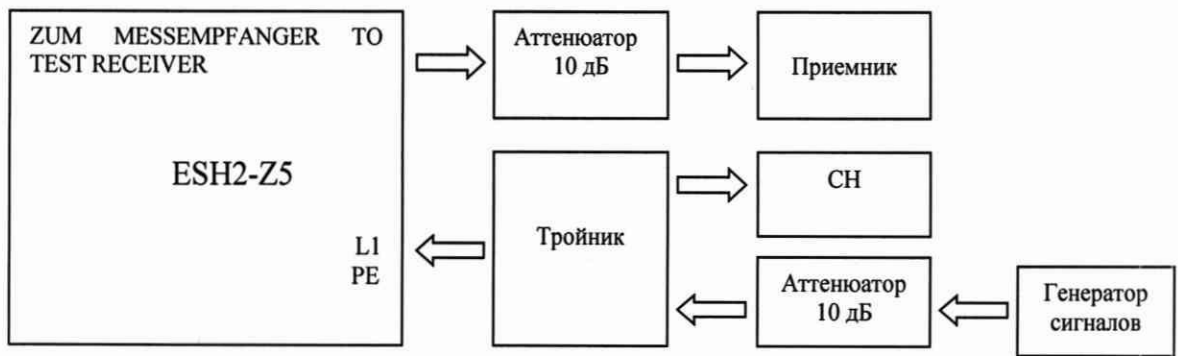
Рисунок 2 - Схема измерений выходного уровня эквивалента сети

9.1.4 Собрать схему измерений, представленную на рисунке 2.