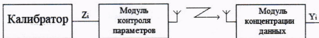
Рисунок 1 - Схема подключения для определения основной приведенной погрешности каналов, реализующих измерение сигналов напряжения постоянного электрического тока и сопротивления

9.2 Определение основной приведенной погрешности каналов, реализующих измерение сигналов сопротивления.