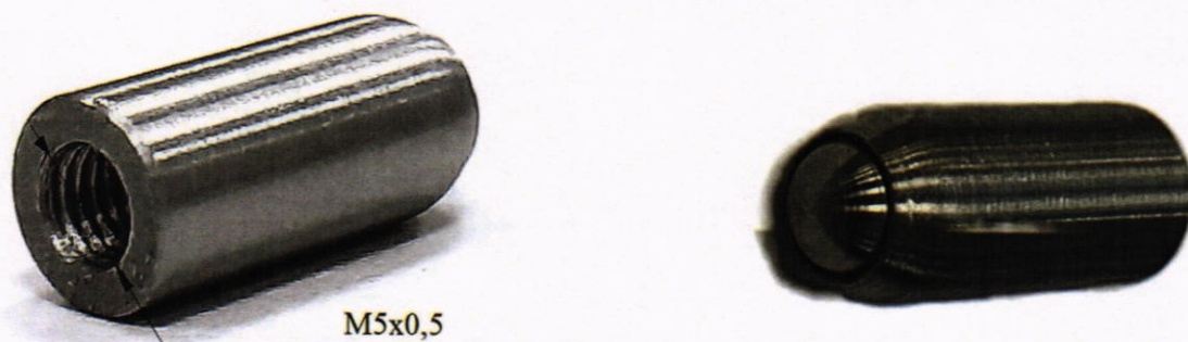
Рисунок Б-1 – Пример используемого сферического наконечника