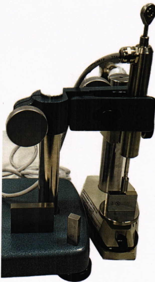
Рисунок Б-2 – Пример установки датчика и расположения КМД