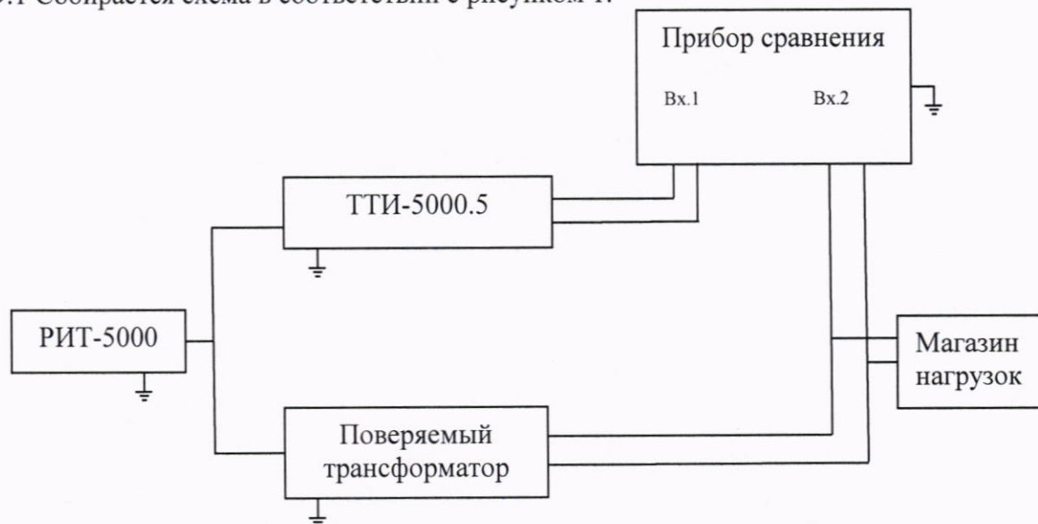
Рисунок 1 – Схема определения токовых и угловых погрешностей трансформаторов

9.1 Собирается схема в соответствии с рисунком 1.