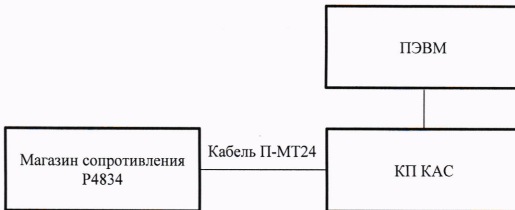
Рисунок 10.1 – Схема подключения

10.1.2 Включить систему, выждать 10 минут, затем на ПЭВМ запустить программу ППВ.