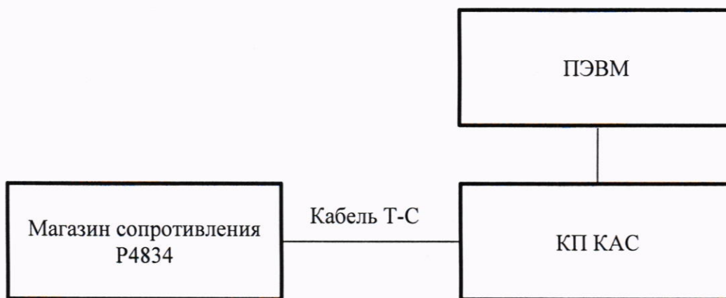
Рисунок 10.3 – Схема подключения

10.3.1 Подготовить рабочее место и собрать схему согласно рисунку 10.3