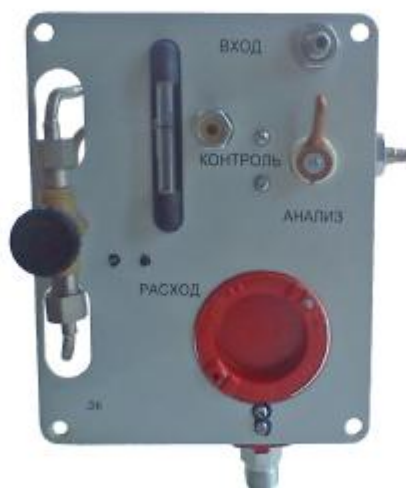
б) БД сигнализаторов