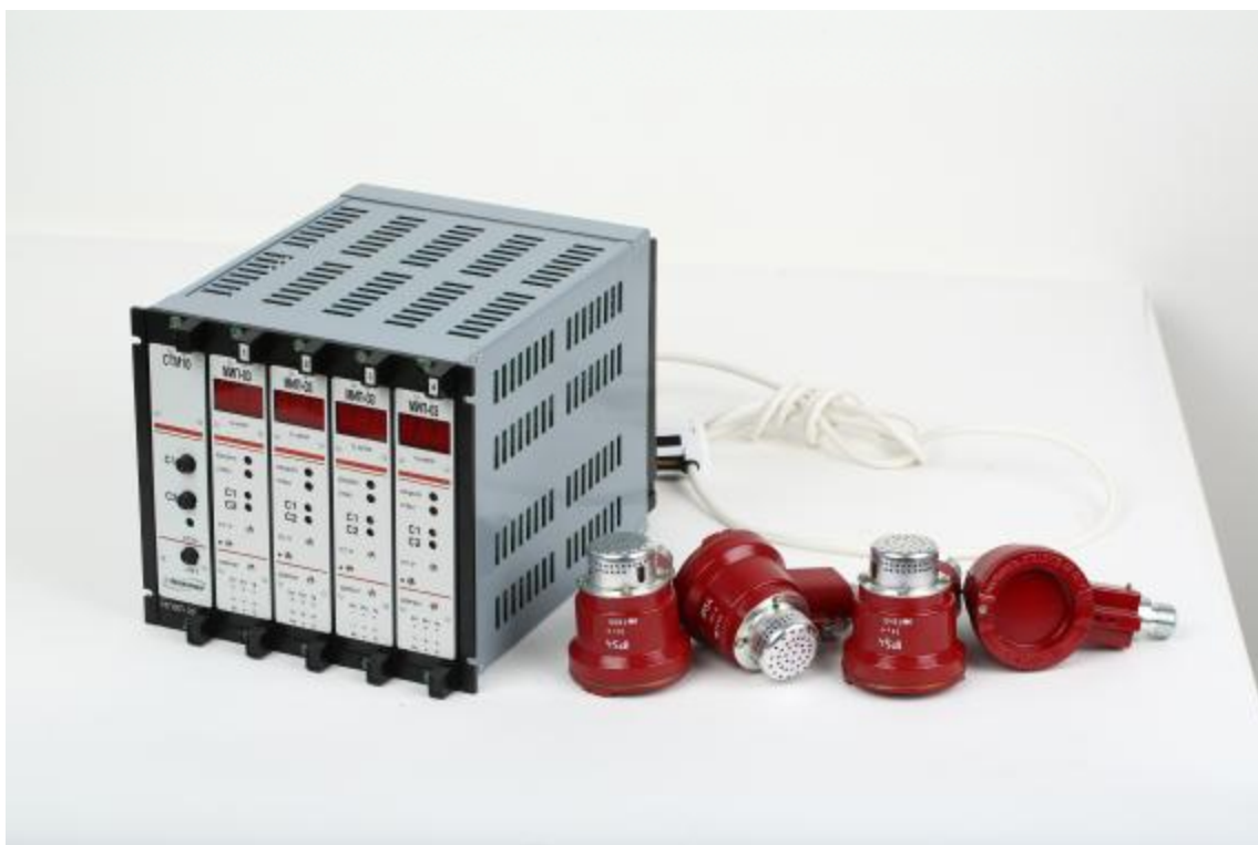
а) БСП с ВД

Внешний вид БСП с ВД приведен на рисунке 1 (а). Внешний вид БД сигнализаторов приведен на рисунке 1 (б). Схема пломбировки от несанкционированного доступа приведена на рисунке 2.