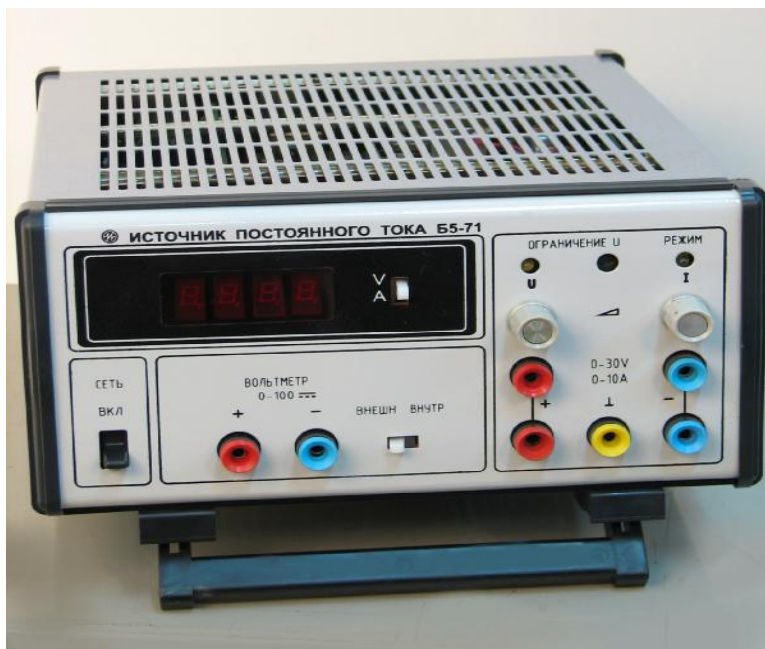
Рис. 1 Внешний вид источника постоянного тока Б5-71.

Внешний вид источника Б5-71 показан на рис. 1, места клеймления и пломбировки от несанкционированного доступа приведены на рис. 2.