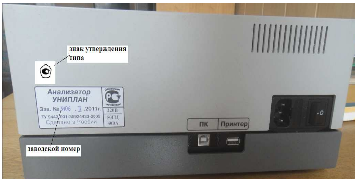
Рисунок 2 – Схема маркировки

Доступ к метрологической части анализатора ограничен. Нижняя панель анализатора зафиксирована винтами, залитыми пломбирующей массой.