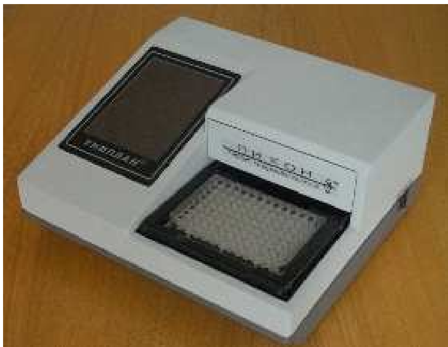
Рисунок 1 – Общий вид анализатора

Оптико-механический блок представляет собой механизм, обеспечивающий взаимно-перпендикулярное перемещение планшета и измерительной головки. Измерительная головка состоит из узла излучения и приемного устройства, между которыми происходит перемещение планшета с измеряемой жидкостью.