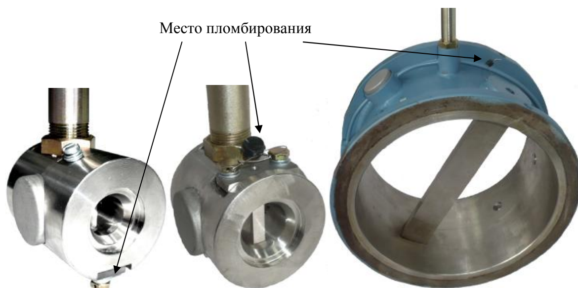
Рисунок 2 – Варианты мест пломбирования в зависимости от Ду