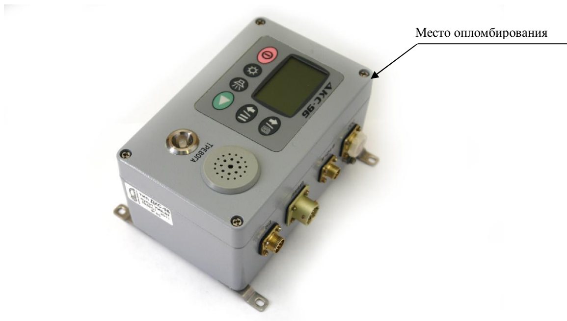
Рисунок 1г – Измерительный пульт УИК-07

Все технические средства, входящие в состав дозиметров-радиометров, опломбированы от несанкционированного доступа в соответствии с конструкторской документацией.