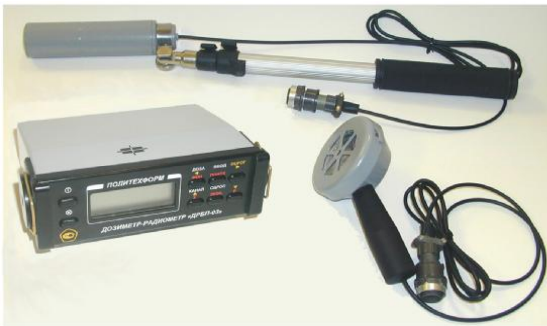
Рисунок 1 - Внешний вид дозиметра с блоками детектирования и штангой

Внешний вид дозиметра и места пломбировки приведены на рисунках 1 и 2.