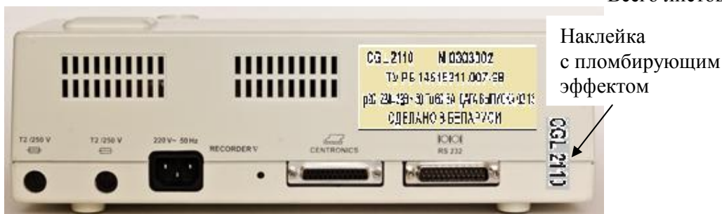
Рисунок 2 – Общая схема маркировки и пломбировки гемокоагулометров