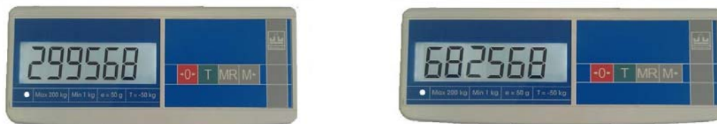
Рисунок 2 - Примеры индикация кода юстировки

Для контроля показаний счетчика (кода юстировки) включают весы и во время прохождения теста нажимают кнопку \ominus и, удерживая ее, нажимают кнопку \uparrow . На индикаторе последовательно отобразятся сообщения «tEst», «CAL S». Нажимают кнопку \uparrow . На индикаторе отобразится код юстировки.