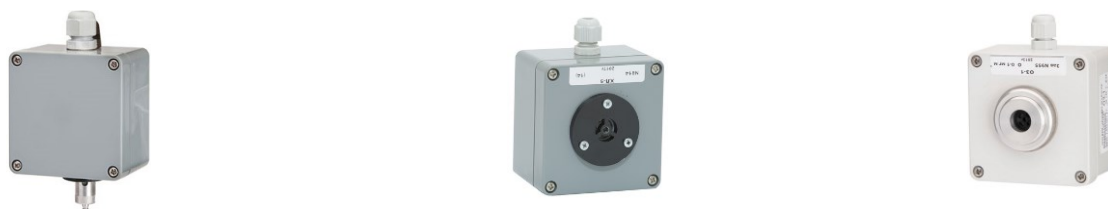
Рисунок 3 - Общий вид измерительных преобразователей ИП