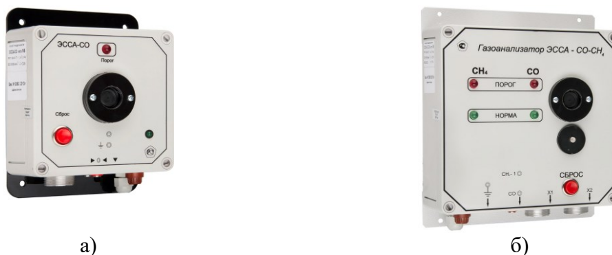
Рисунок 1 - Общий вид газоанализаторов ЭССА исполнение МБ (блок измерения и сигнализации БИС): а) - ЭССА-CO; б) - ЭССА-CO-CH4

Нанесение знака поверки на газоанализаторы не предусмотрено. Знак поверки наносится в паспорт или на свидетельство о поверке.