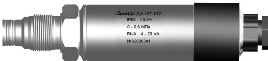
Рисунок 2- Датчик избыточного давления МИДА-ДИ-12П-072