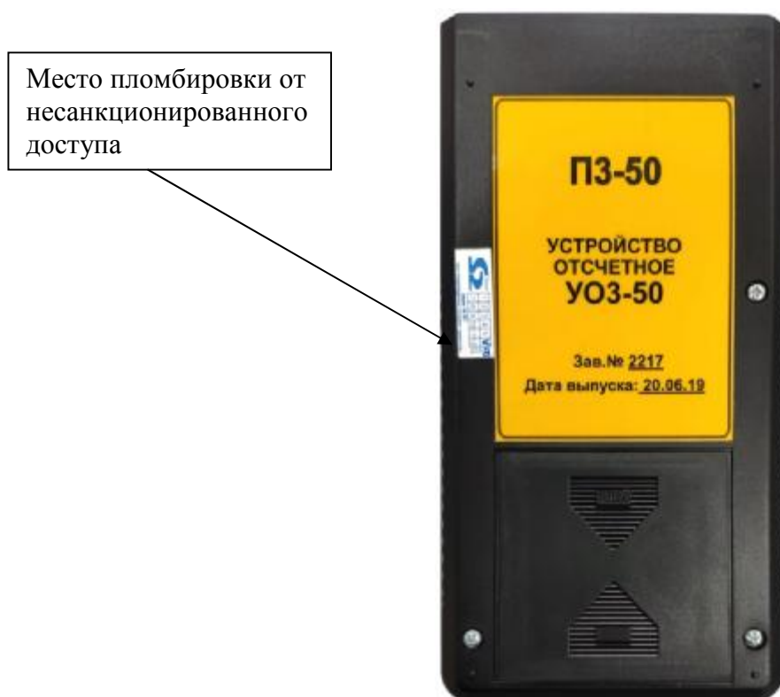
Рисунок 3 – Общий вид задней панели устройства отсчетного УОЗ-50

Измерители выпускаются в различной комплектации, различающиеся типом и количеством поставляемых АП: