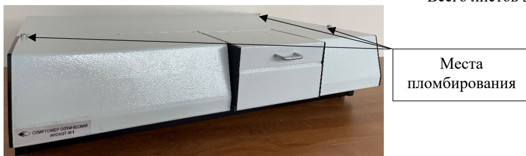
Рисунок 1 - Общий вид спиртомера ИКОНЭТ-М с указанием мест пломбирования