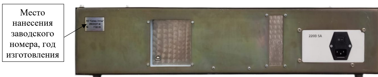
Рисунок 3 – Вид задней панели спиртомера ИКОНЭТ-М. Место нанесения заводского номера спиртомеров, года изготовления