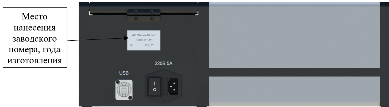
Рисунок 4 – Вид задней панели спиртомера ИКОНЭТ-М1. Место нанесения заводского номера спиртомеров, года изготовления