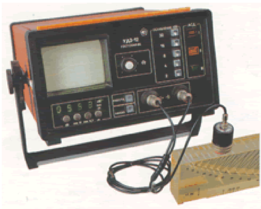
Рис.1 Общий вид.

Фотография мест пломбировки от несанкционированного доступа приведена на рисунке 2.