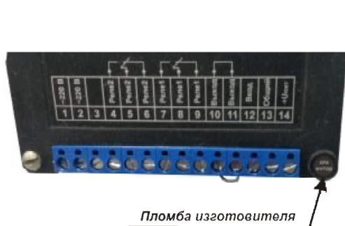
а) Место опломбирования преобразователя «Радон РИЦ» щитового исполнения

Для предотвращения доступа к элементам конструкции преобразователи настенного исполнения пломбуются изготовителем установкой мягкой пломбы в чашку винта в нижней части передней крышки корпуса. Преобразователи щитового исполнения пломбуются аналогичным способом на задней панели корпуса. Результаты поверки оформляются нанесением знака поверки в паспорт или свидетельство о поверке.