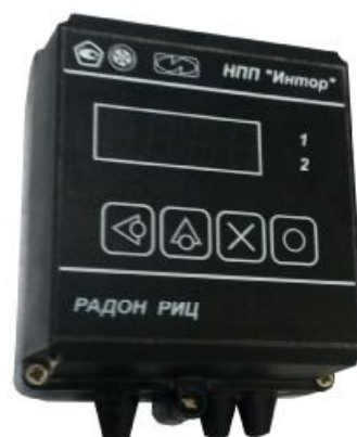
б) Преобразователь «Радон РИЦ» настенного исполнения