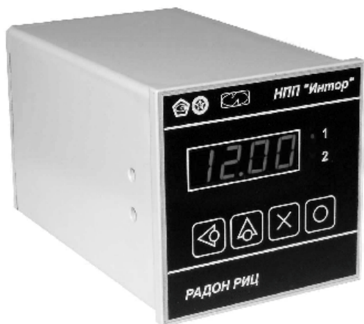
а) Преобразователь «Радон РИЦ» щитового исполнения