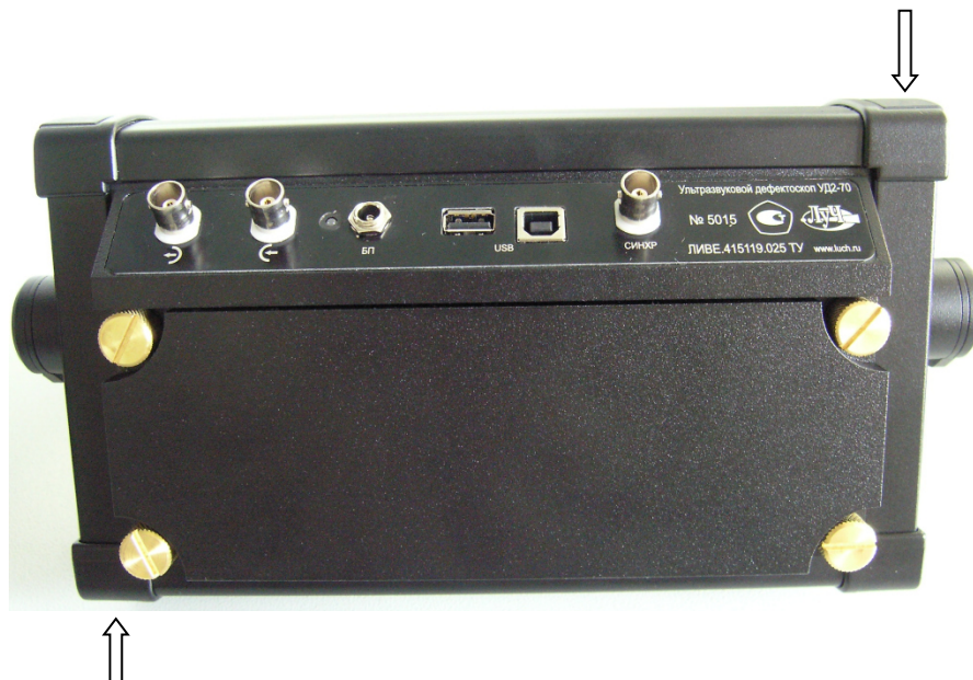
Рисунок 2а – Общий вид задней панели дефектоскопов ультразвуковых УД2-70 в металлическом корпусе и места нанесения пломбирки.