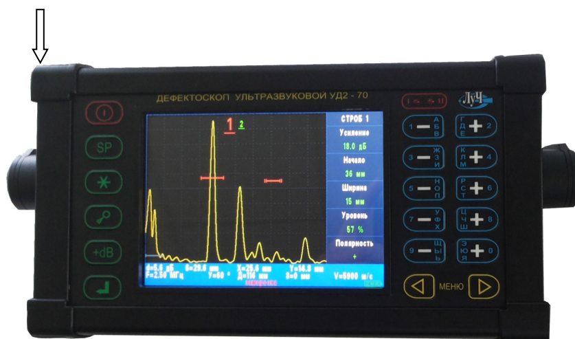
Рисунок 1а - общий вид дефектоскопов ультразвуковых УД2-70 в металлическом корпусе и места нанесения пломбировки.

Электронный блок может выпускаться в двух исполнениях: в жестком металлическом корпусе с ручкой для переноски (рисунок 1а) и в пластиковом корпусе (рисунок 1б). На лицевой панели расположены многофункциональный цветной жидкокристаллический дисплей и маслобензостойкая пленочная клавиатура. Конструкция дефектоскопа предусматривает пломбирование электронного блока прибора от несанкционированного доступа. Внешний вид и места пломбирования указаны стрелками на рисунке 1а и 1 б.