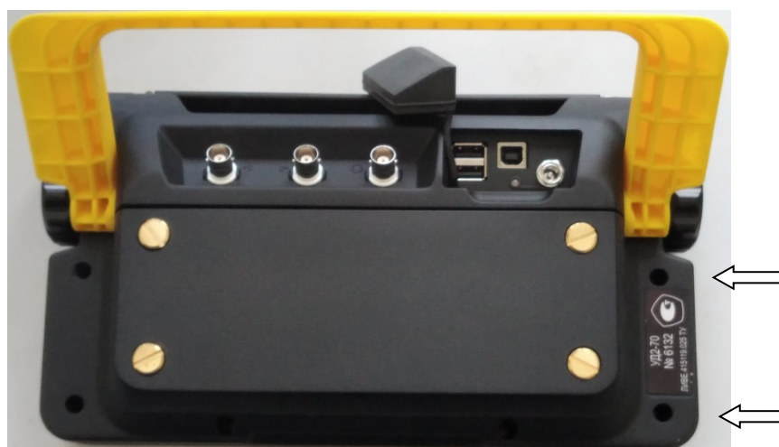
Рисунок 2б - Общий вид задней панели дефектоскопов ультразвуковых УД2-70 в пластиковом корпусе и места нанесения пломбировки.

На задней панели (рисунок 2а и 2б ) расположены коммутационные разъемы для подключения УЗ ПЭП, блока питания, вход и выход синхроимпульсов и USB-разъемы для подключения внешних устройств. Аккумуляторная батарея крепится к задней панели блока при помощи винтов.