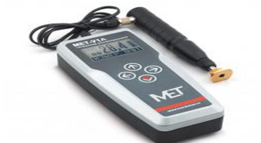
Рисунок 3 – Внешний вид твердомера MET-U1A