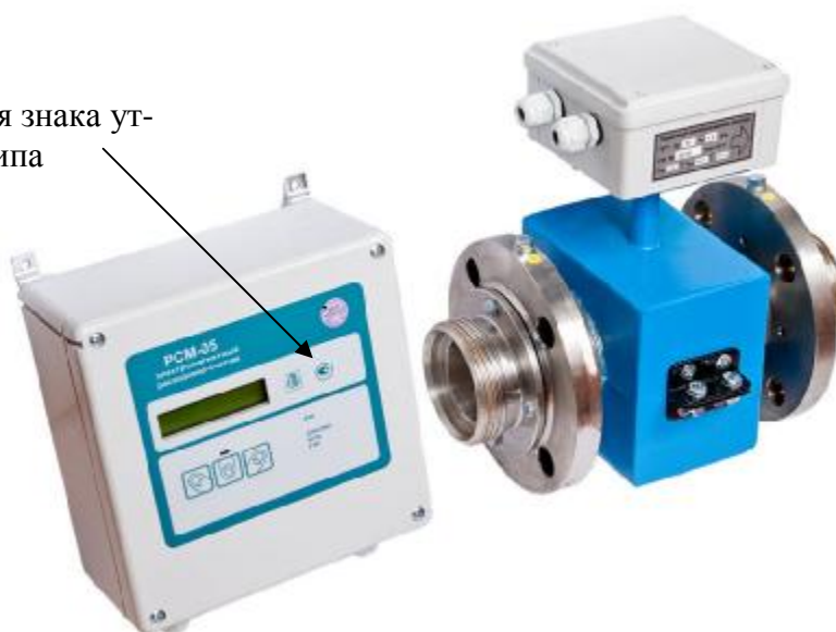
Рисунок 1 - Внешний вид расходомера модификаций РСМ-05.03С и РСМ-05.03СМ

Место для нанесения знака утверждения типа