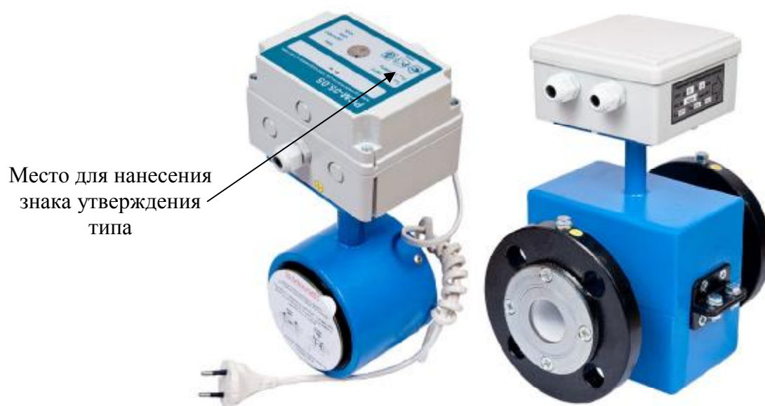
Рисунок 2 - Внешний вид расходомера модификаций РСМ-05.05С, РСМ-05.05СМ, РСМ-05.07 и РСМ-05.07М

Схема пломбирования расходомеров для защиты от несанкционированного доступа с указанием мест для нанесения оттиска знака поверки и знака поверки в виде наклейки приведена на рисунке 3.