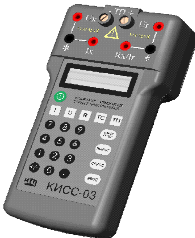
Рисунок 1 – Фотография общего вида

Схема пломбировки от несанкционированного доступа представлена на рисунке 2.