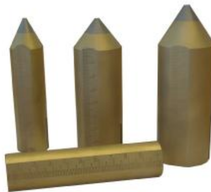
Рис. 4. Грузы из латуни.