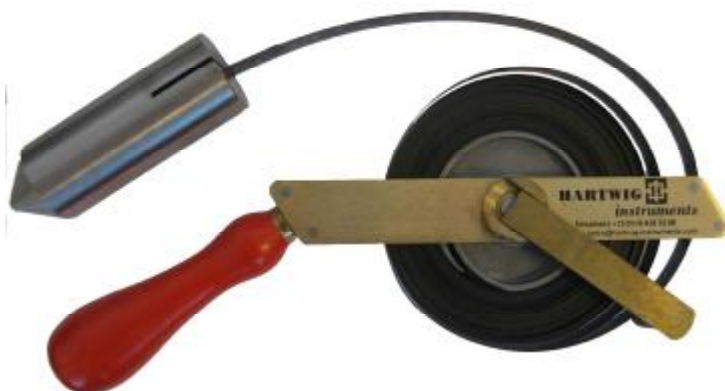
Рис. 2 Рулетка измерительная металлическая D 80 из углеродистой стали.