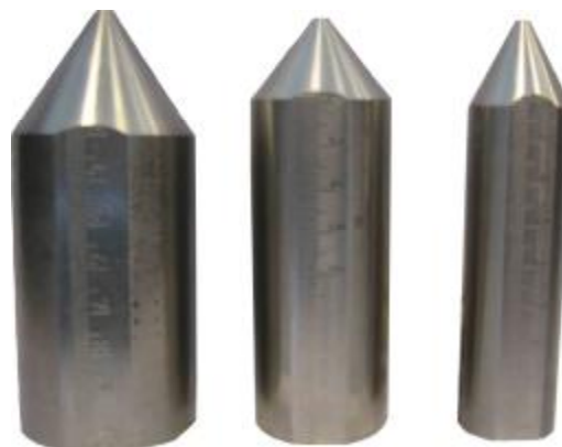
Рис.5. Грузы из нержавеющей стали.