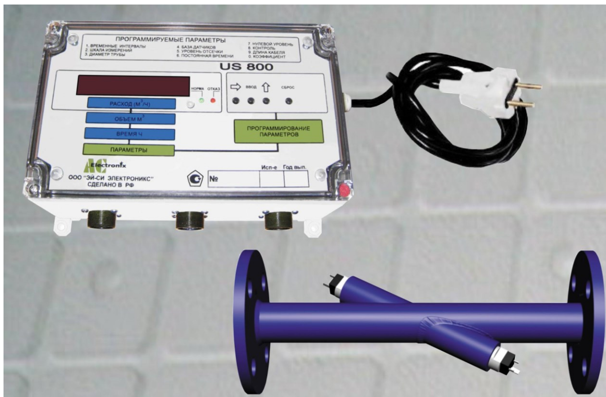
Рисунок 1 - Общий вид расходомера-счетчика жидкости ультразвукового US800 и УПР

Общий вид расходомера-счетчика жидкости ультразвукового US800 и УПР приведены на рисунке 1.