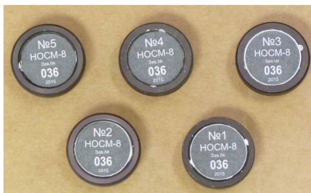
Рисунок 1 - Общий внешний вид наборов стеклянных мер НОСМ-8

Набор состоит из мер, представляющих собой светофильтры диаметром 20 мм из оптических стекол К8, ОС-6, ЖЗС18, ЖЗС-5 и МС20. Светофильтры помещены в дюралюминиевый цилиндрический корпус. Общий внешний вид наборов стеклянных мер приведен на рисунке 1. На корпусе каждой меры выгравирована надпись, содержащая порядковый номер светофильтра и заводской номер набора. Все входящие в набор меры уложены в футляр, приведено на рисунке 2.