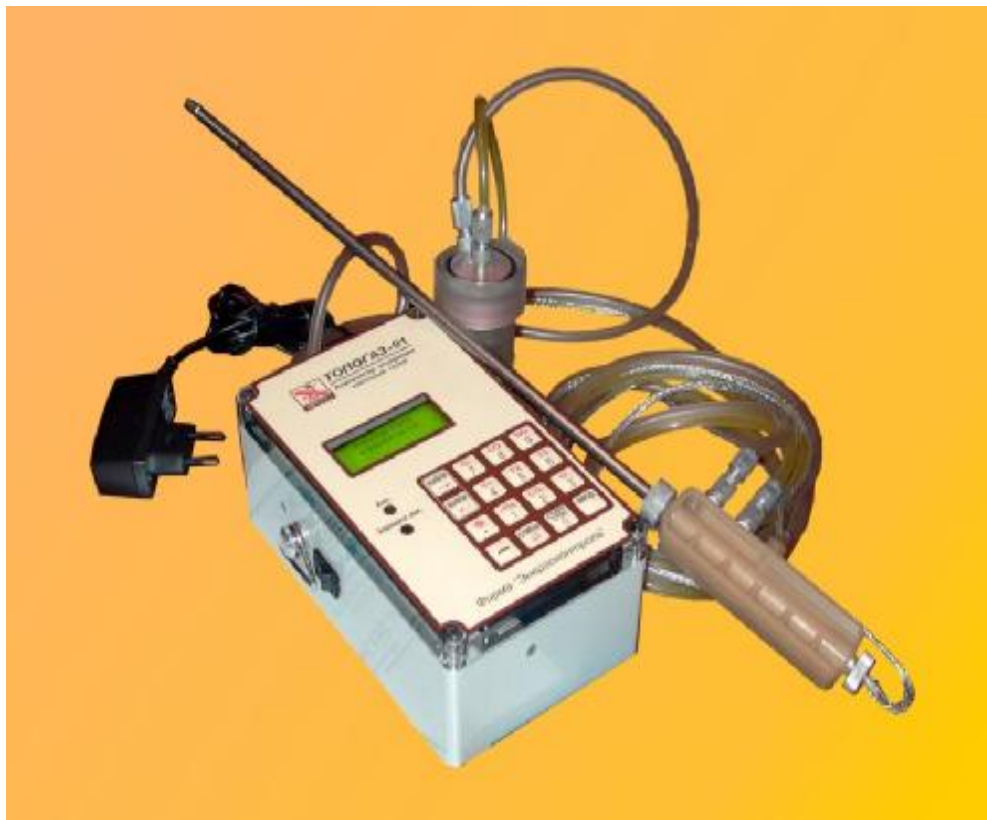
Рис.2 Общий вид газоанализатора «Топогаз-01»

ФК – фильтр грубой очистки с конденсатосборником; CO, NO, O 2 – электрохимические датчики для измерения концентрации кислорода, оксидов углерода и азота; dP – датчик давления; Т 1 , Т 2 – датчики температуры.