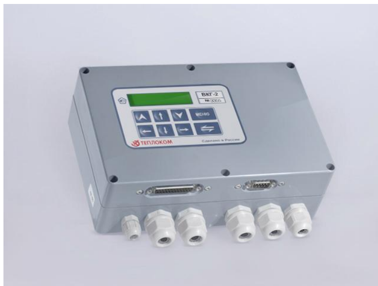
Рисунок 1 – Внешний вид вычислителя