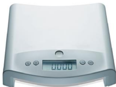
Весы seca 354