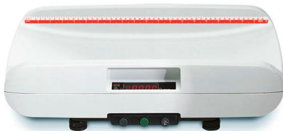
Весы seca 727