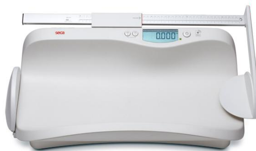
Весы seca 374