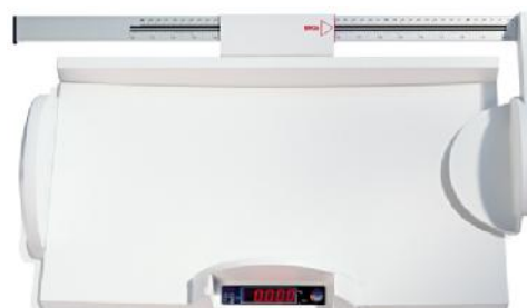
Весы seca 728