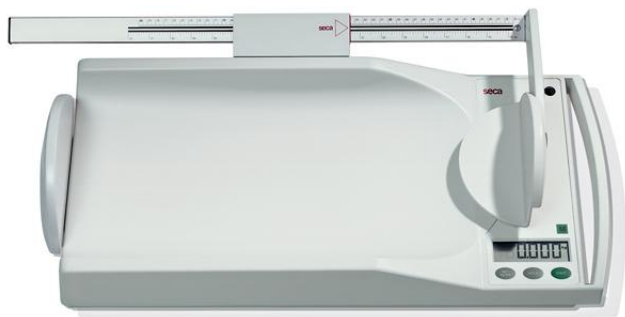
Весы seca 334

Общий вид весов представлен на рисунке 1.