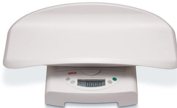
Весы seca 383