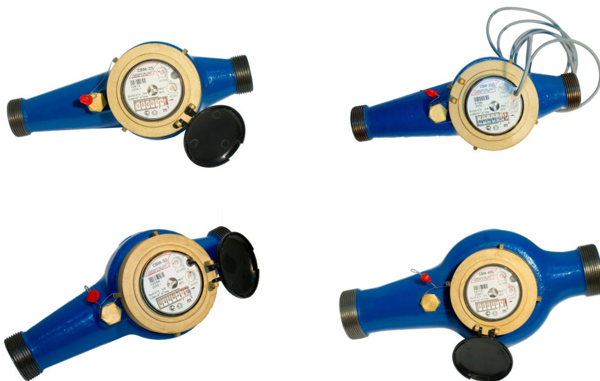
Рисунок 1 - Общий вид счетчиков СВМ