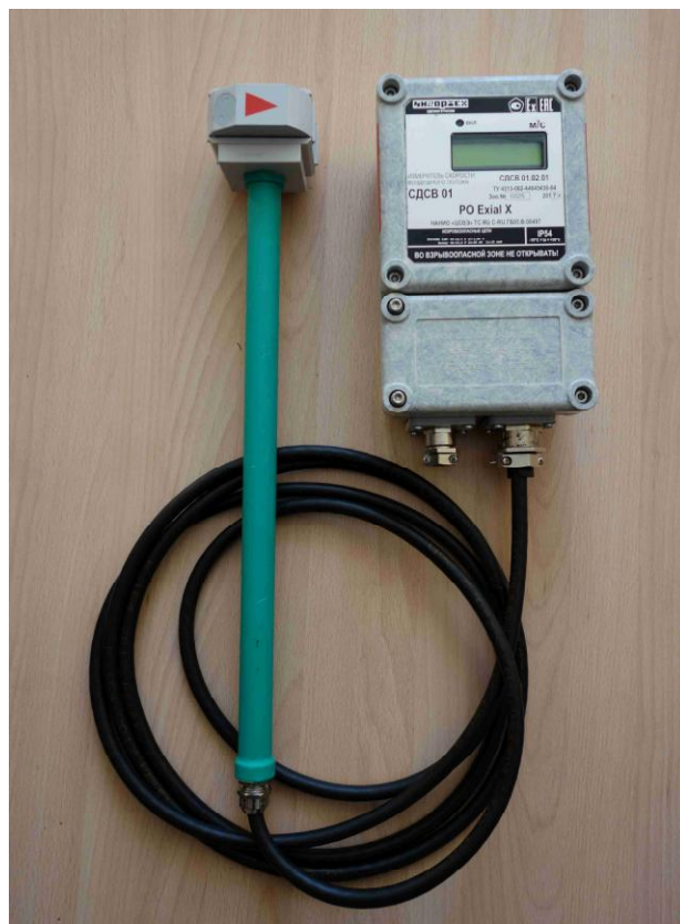
Рисунок 1 - Общий вид измерителя модификаций СДСВ 01.YY.XX-t.dd в разных вариантах исполнения корпуса