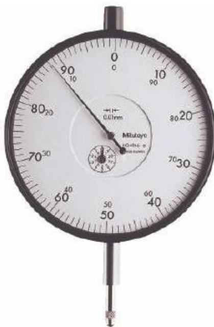
Рисунок 4 - Головки измерительные серии 4