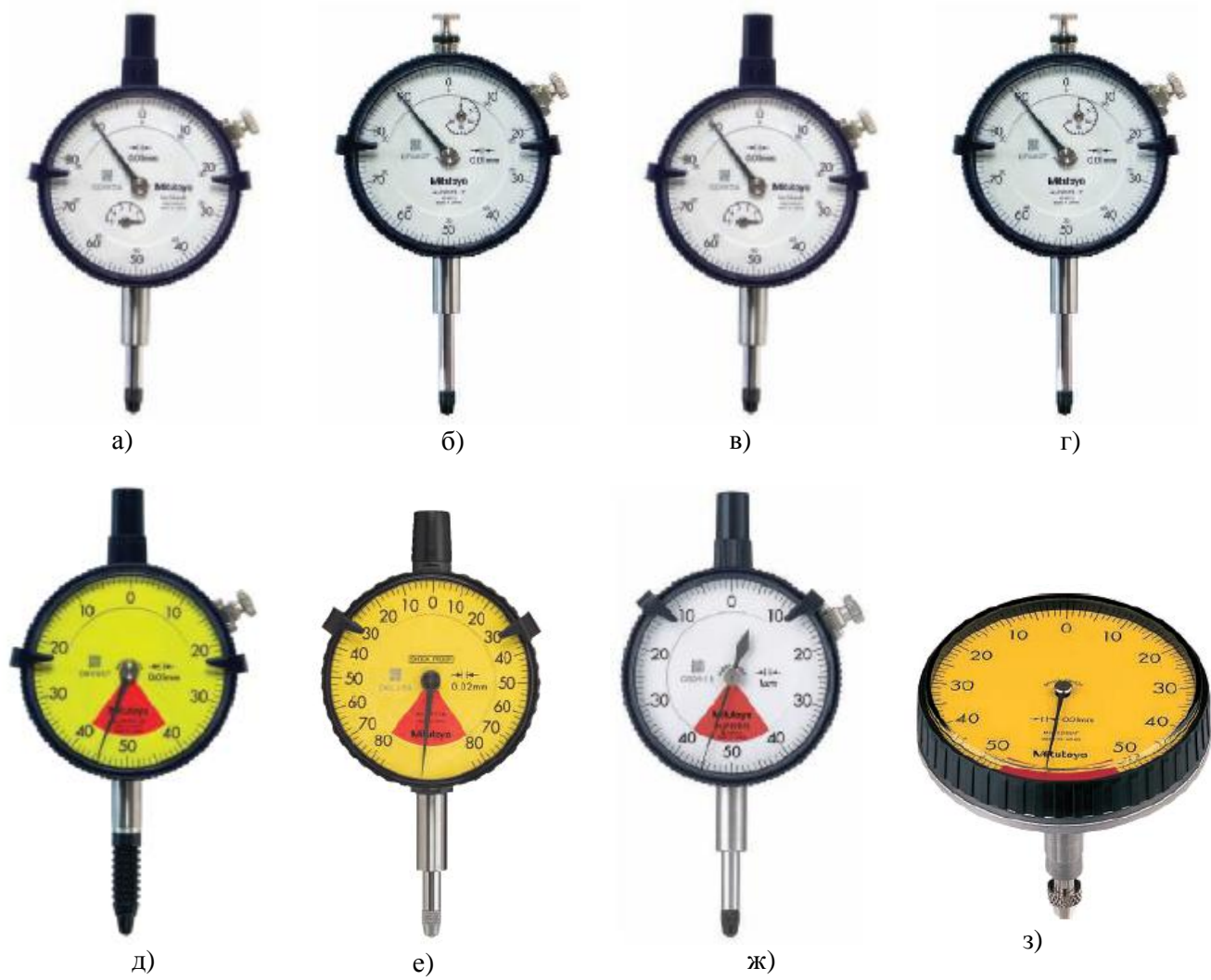
Рисунок 2 - Головки измерительные серии 2