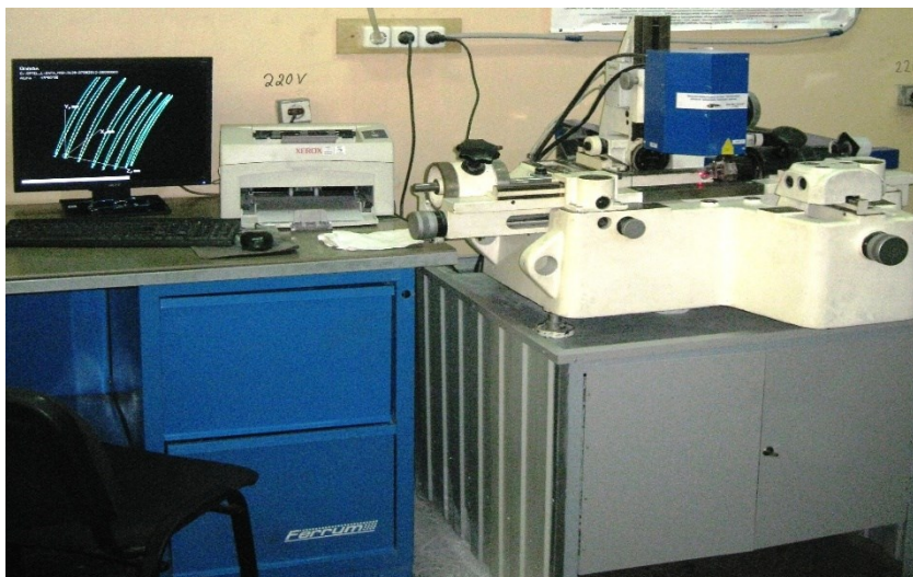
Рисунок 2. Внешний вид системы ОПТЭЛ-2