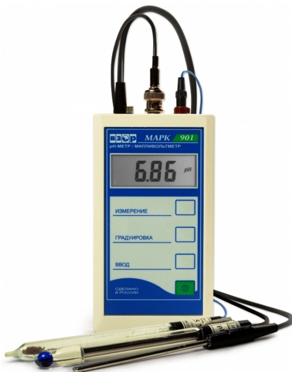
Рисунок 1 - Общий вид рН-метра

Схема пломбирования от несанкционированного доступа к элементам конструкции, обозначение места нанесения знака поверки представлены на рисунке 2.