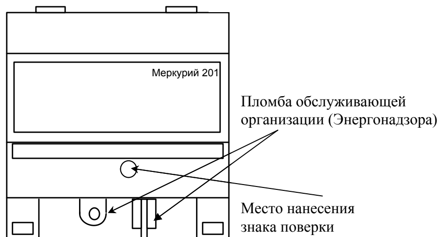
Рисунок 6 - Схема пломбировки от несанкционированного доступа, обозначение места нанесения знака поверки счётчиков «Меркурий 201.1», «Меркурий 201.2», «Меркурий 201.22», «Меркурий 201.3», «Меркурий 201.4», «Меркурий 201.42», «Меркурий 201.5», «Меркурий 201.6»