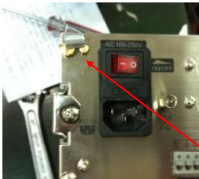
CI-501, CI-502, CI-503, CI-505, CI-507