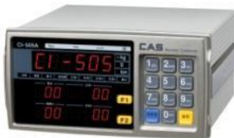
CI-503, CI-505, CI-507