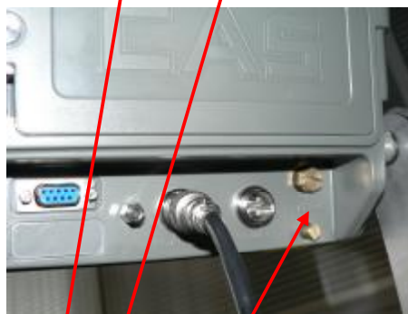
CI-200A, CI-200S/SC, CI-201A, CI-201S/SC