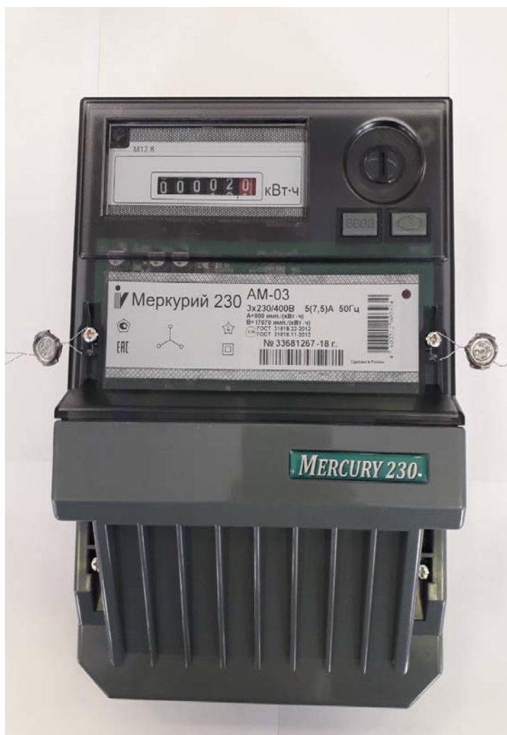
Рисунок 1- Общий вид счетчика с закрытой клеммной крышкой

Общий вид счётчиков электрической энергии трёхфазных статических «Меркурий 230АМ» представлен на рисунке 1.