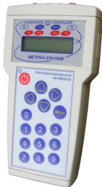
Рисунок 1 – Фотография общего вида калибратора