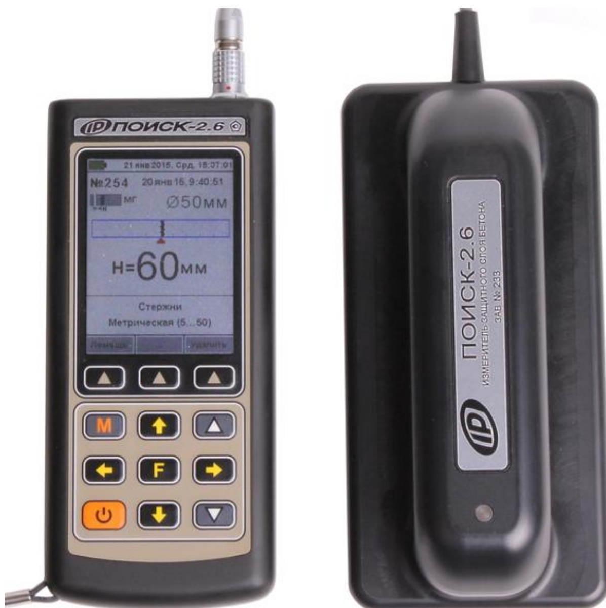
Рисунок 4 – Общий вид прибора модификации Поиск-2.6