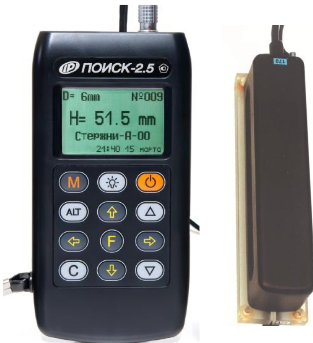
Рисунок 3 – Общий вид прибора модификации Поиск-2.5