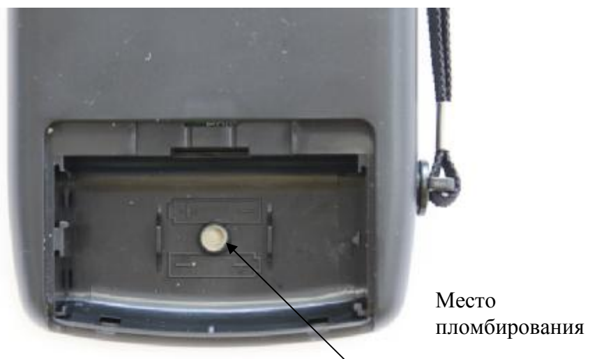
Рисунок 1 - Место пломбирования и клеймения приборов модификации Поиск-2.5 (двух исполнений)

Фотографии общего вида приборов и места пломбирования представлены на рисунках 1-4.