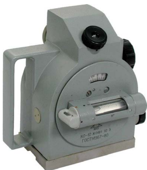
Рисунок 1 – Квадрант оптический КО-10