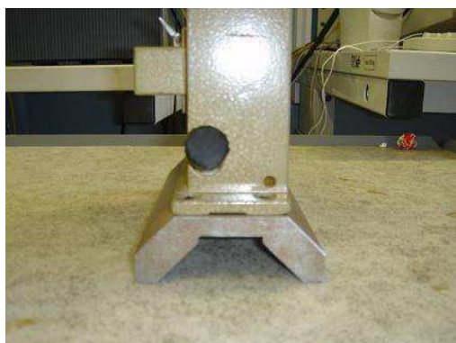
Рисунок 3 – Основание квадранта оптического КО-60М