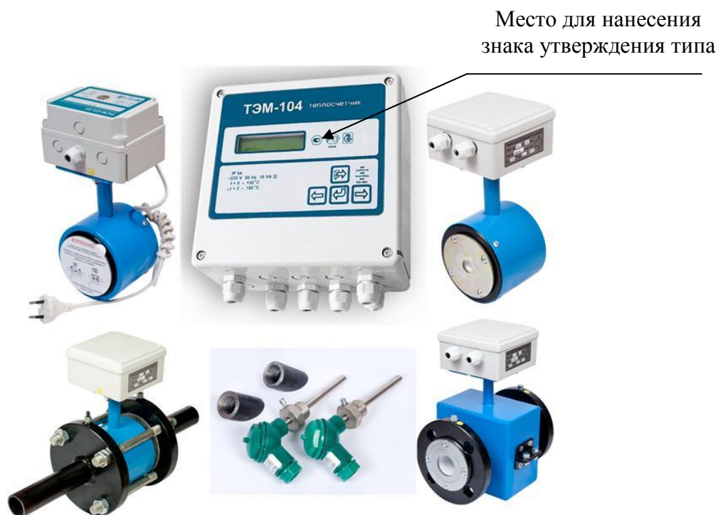
Рисунок 1– Внешний вид теплосчетчика с максимально возможным числом измерительных каналов (исполнение ТЭМ-104-4)

Внешний вид теплосчетчика приведен на рисунках 1 и 2.