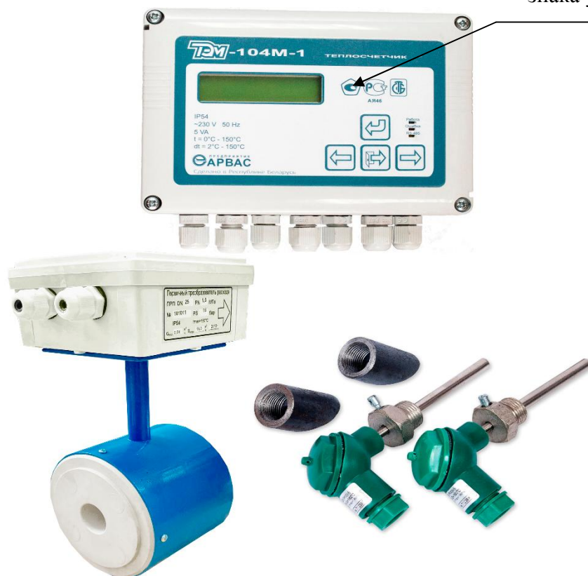
Рисунок 2– Внешний вид теплосчетчика (исполнение ТЭМ-104М-1)

Место для нанесения знака утверждения типа