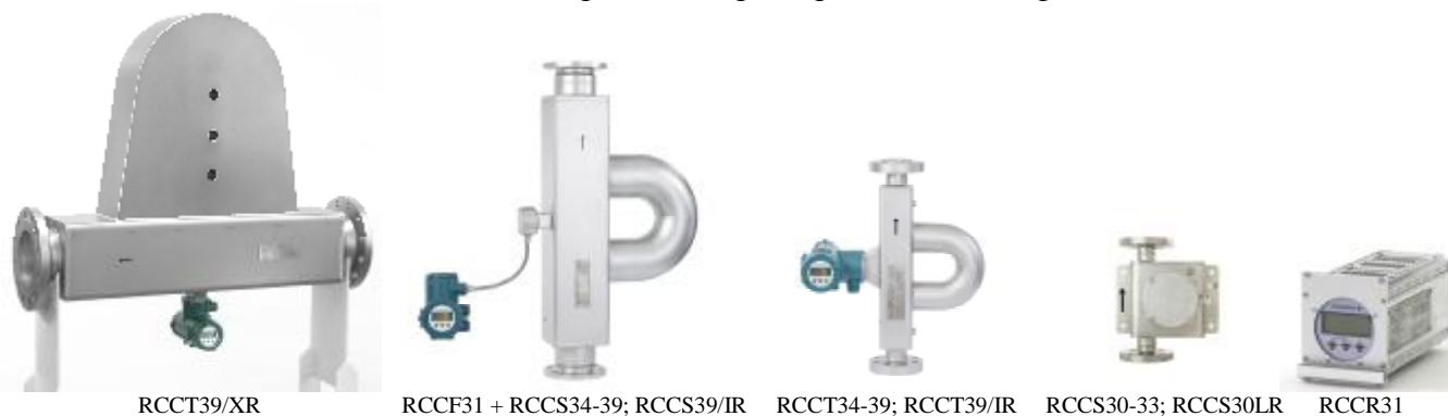
Фото 1. Фотография общего вида

Общий вид расходомеров представлен на фото 1.