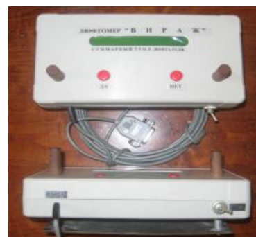
Рисунок 2 - Общий вид основного блока