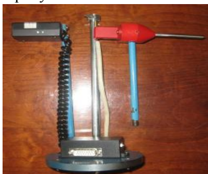
Рисунок 1 - Датчики перемещения колеса, слева - ДПК для Вираж-Л, справа - ДПК для Вираж-К

Приборы Вираж изготавливаются в двух модификациях: Вираж-К – для измерения суммарного люфта в рулевом управлении АТС с контактным датчиком перемещения колеса; Вираж-Л – для измерения суммарного люфта в рулевом управлении АТС с бесконтактным (лазерным) датчиком перемещения колеса (рисунок 1 и рисунок 2). Схема пломбировки показана на рисунке 3.