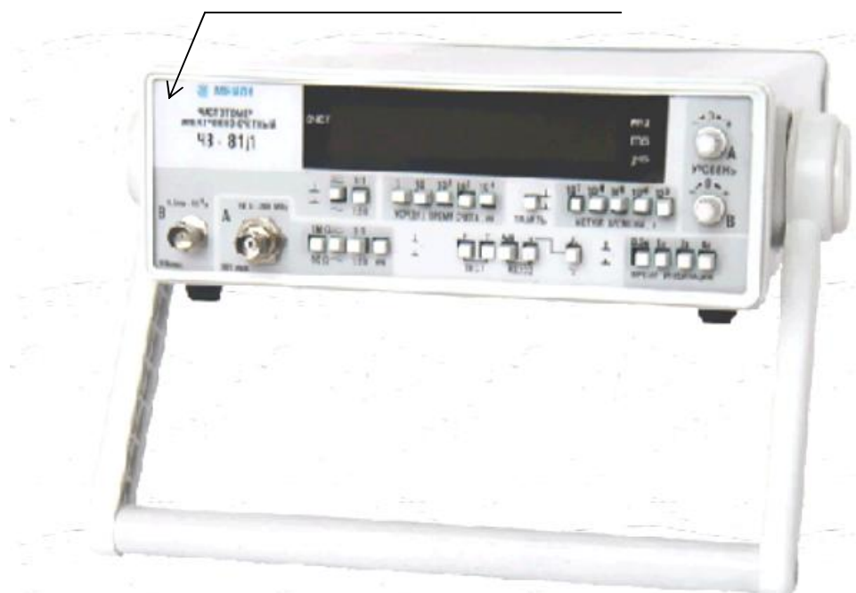
Рисунок 1 – Общий вид частотомера электронно-счетного ЧЗ-81 с указанием места нанесения знака поверки