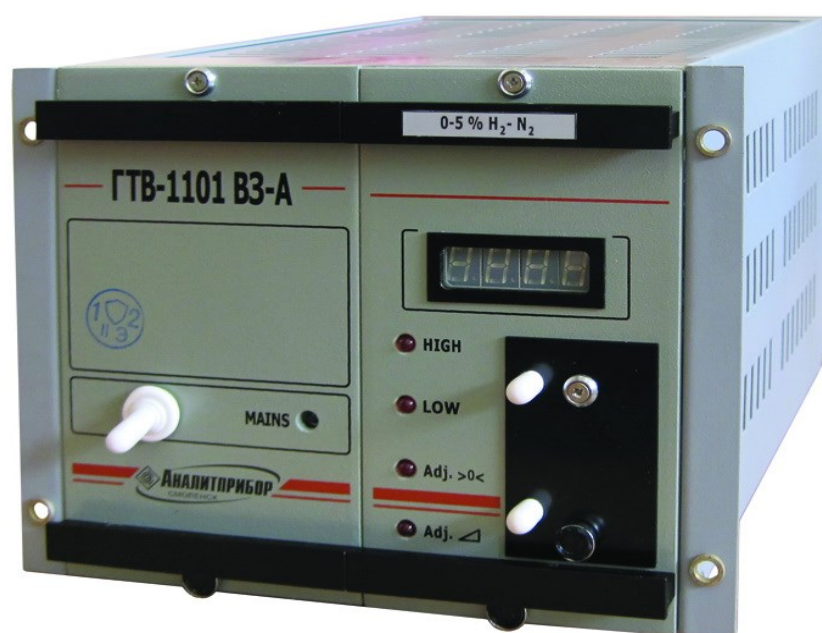
а) преобразователь измерительный

Общий вид средства измерений представлен на рисунке 1.