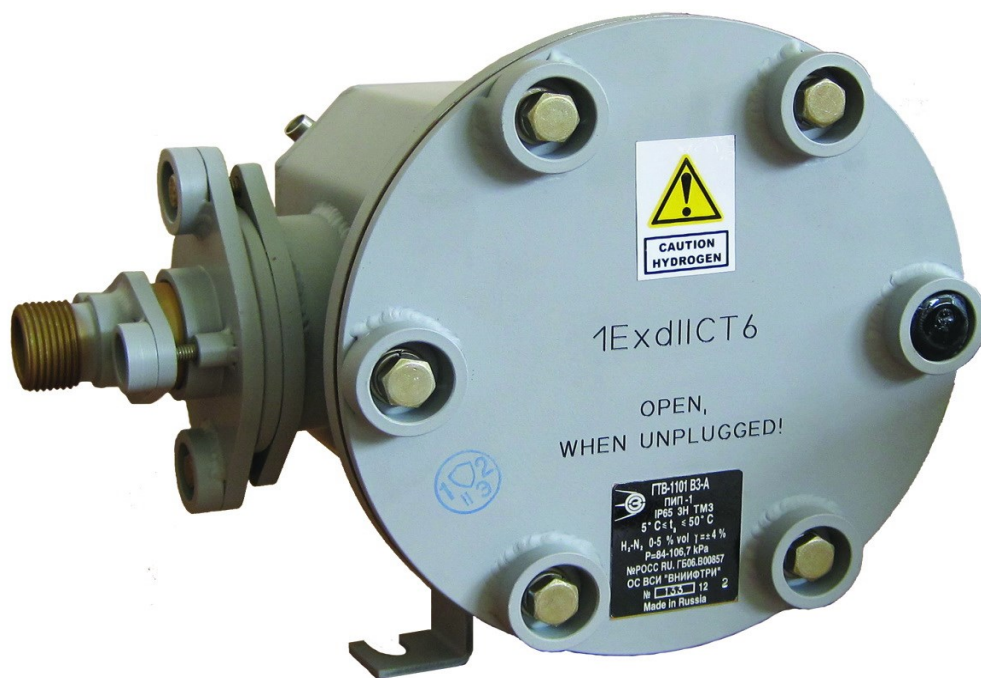
б) преобразователь первичный