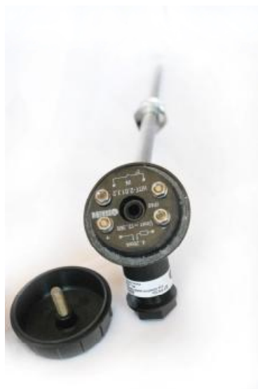
Рисунок 4 - Общий вид ДТП модификации XX5 со встроенным нормирующим преобразователем