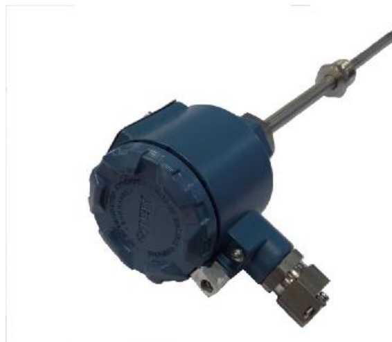
Рисунок 3 - Общий вид ДТП с клеммными головками модификации ХХ5